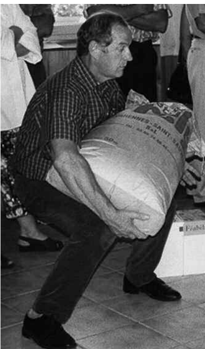
Une bonne position au travail

«Pour remettre à niveau ses connaissances»