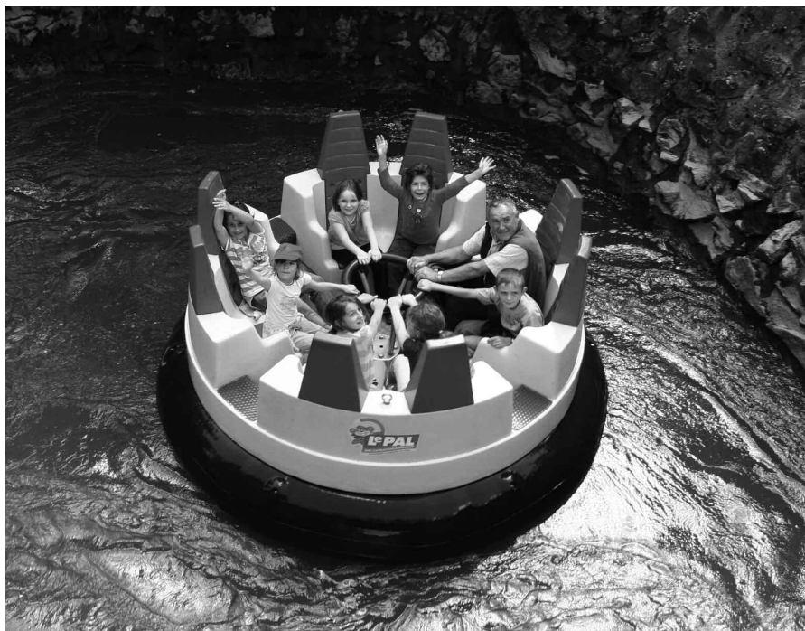
Une journée riche en émotions... !

Dans le cadre d'un nouveau dispositif de majoration des petites retraites, 10 000 retraités agricoles ont été invités à retourner un questionnaire à la MSA71. Environ 80 % des retraités interrogés ont effectué cette démarche. Près de 46 % de ces derniers ont bénéficié d'une majoration de retraite à effet du 1 er janvier 2009. Ce pourcentage pourrait être légèrement augmenté, certains questionnaires ayant fait l'objet d'un complément d'étude.