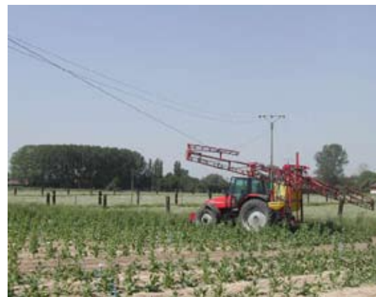
Sous les lignes électriques, il convient de prendre des précautions avec le matériel agricole.

Taux AGS au 1er juillet 2009 : 0,30 % (au lieu de 0,20 % comme indiqué sur le barème du 3T2009 transmis avec les déclarations de salaires fin juin).